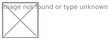
Ilustración 13 - Ciclo de vida de la adopción de Scrum (Definir y priorizar el Backlog).

En esta fase del ciclo de vida de la adopción de Scrum se realiza la definición y priorización de las tareas y temas que fueron definidos en el Backlog.